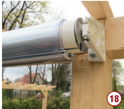
Die Verbindungsschraube einsetzen...