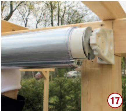
und in den Halter einsetzen.