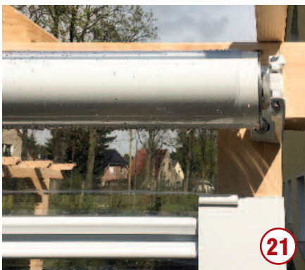
...und das Rollo zur Probe herunterfahren.