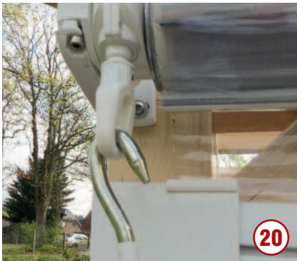
Nun die Kurbel einhängen...