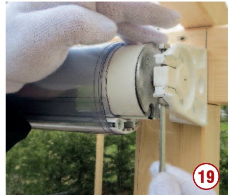
...und mit der Inbusschraube arretieren. ACHTUNG! Nur leicht anziehen!